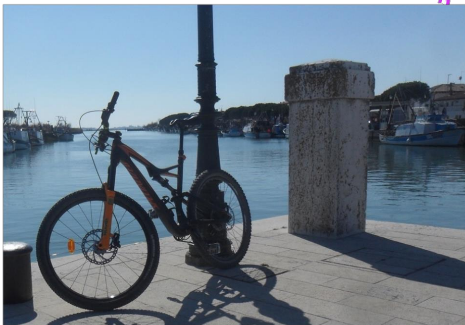
Pontile di Marano Lagunare

Via Brigata Re, 29 – Udine Segreteria – tel. (+39) 0432 504290 Orario: mer-giov-ven 17.30-19.00, giovedì anche dalle 21 alle 22.30 mail: escursionismo@alpinafriulana.it website: www.alpinafriulana.it