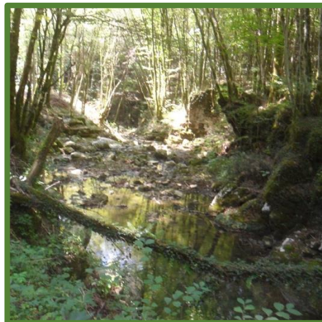
Rio della Madonna