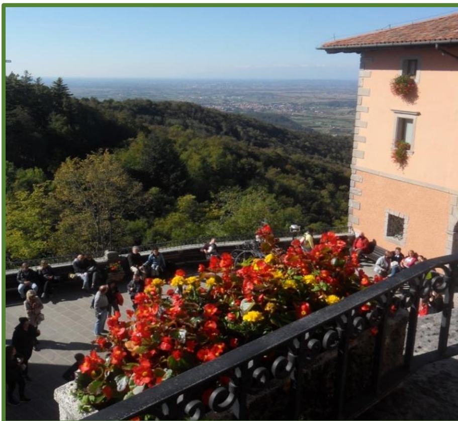
Vista verso Udine dal Santuario di Castelmonte

LEGGERE Modalità iscrizione e partecipazione + Regolamento in calce