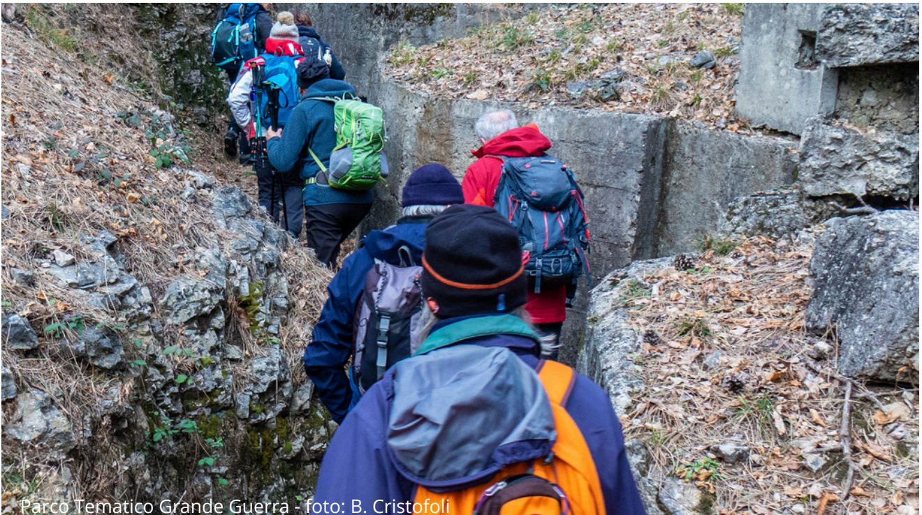
Parco Tematico Grande Guerra

h 08.30 Gemona - parcheggio bar "Al Fungo"