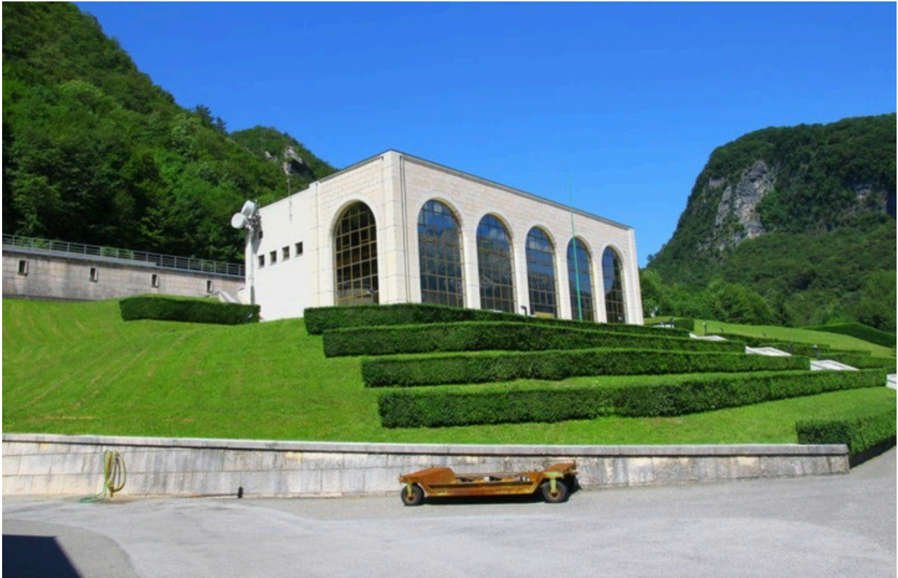
Centrale di Somplago

La visita alla centrale prevista alle ore 14.00, sarà preceduta, in sala riunioni, da una illustrazione del sistema derivatorio nel bacino del Tagliamento e dei dati della centrale.