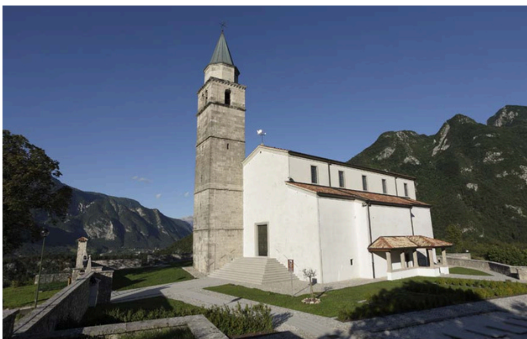
Pieve di Santo Stefano

La posizione dominante della rupe (formatasi con piccole faglie ed incisa da correnti torrentizie) sovrasta l'altopiano; fin dai tempi dei Romani, è stata sfruttata come torre di avvistamento che, collegata con altre, trasmetteva segnali fino ad Aquileia.